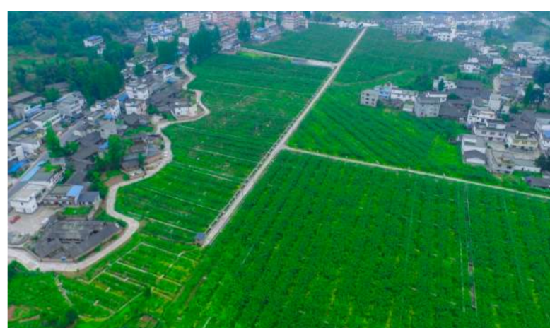
绿色家园雅安。图为芦山县飞仙关镇绿色产业基地边的村庄。