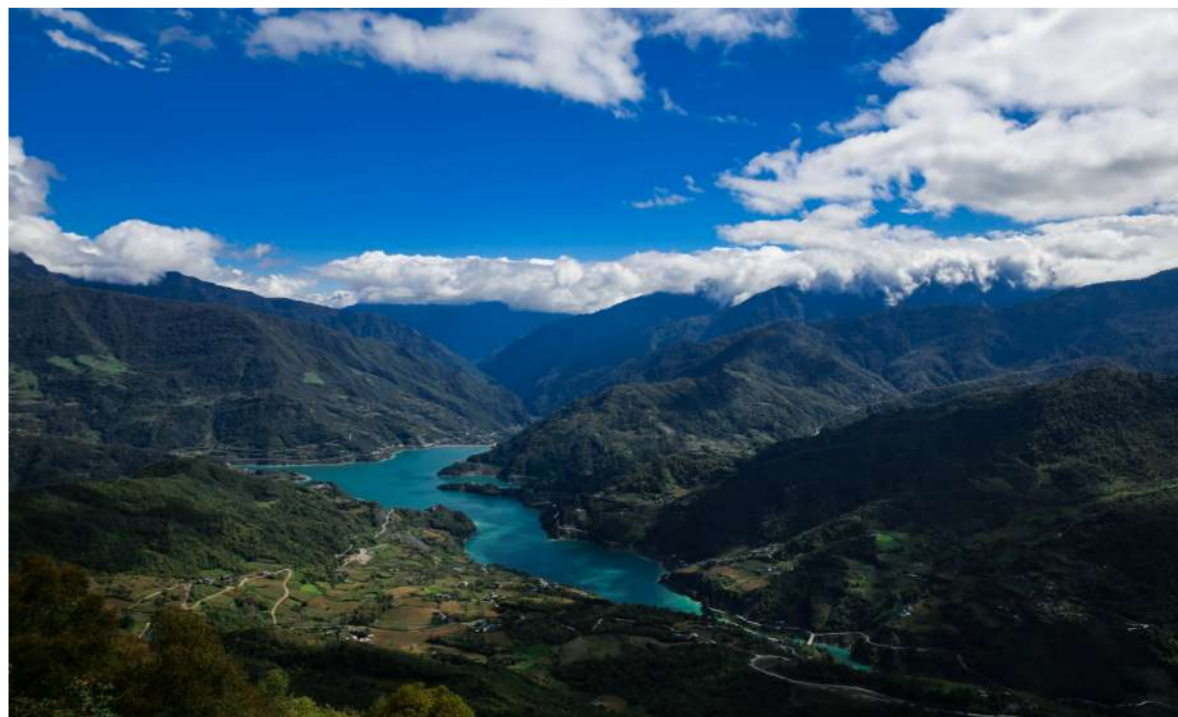
宝兴硗碛湖,青山环抱中的绿宝石。