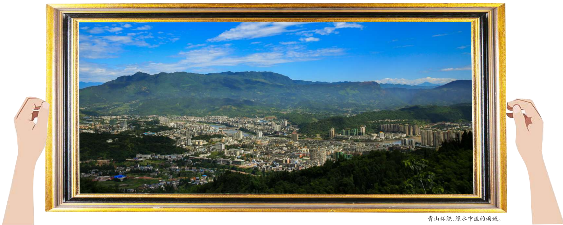
青山环绕、绿水中流的雨城。