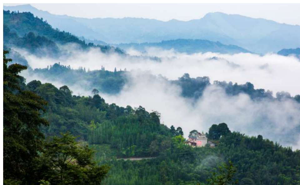
到2020年,全市将完成营造林255万亩,得益于多年来的生态保护,雅安处处望得见青山。