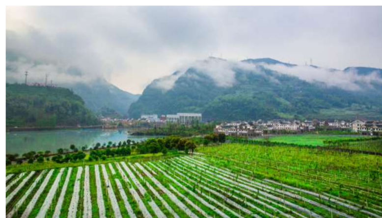
天全县多功乡南天新镇产村相融。