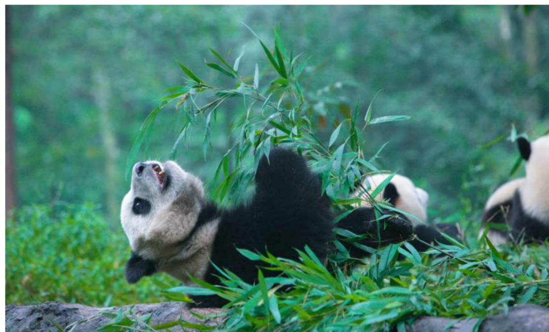
熊猫家园雅安。图为绿林间悠闲自在的大熊猫。