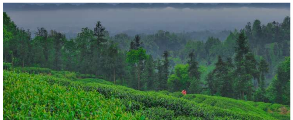
我市中高山地区茶园与云海相伴。